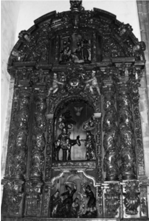
Fig. 7. ¿Miguel de Romay o Ciprián Domínguez Bugarín?, retablo colateral de la Cofradía de la Esclavitud, San Paio de Antealtares (Santiago de Compostela), antes de 1712.