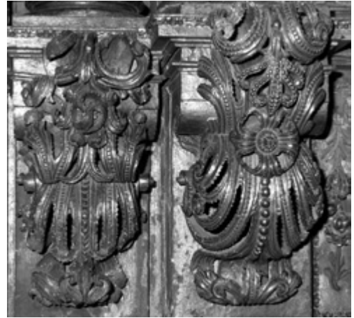
Fig. 8. ¿Miguel de Romay o Ciprián Domínguez Bugarín?, detalle de los netos y talla "escarolada".

En resumen, fue éste el "estilo aportuguesado" que cuajó en Santiago de Compostela por los años de 1700-1714 (aprox.); hay que diferenciar dos "recetas" que caracterizan su evolución y, por consiguiente, el estilo de algunos artífices: a) por una parte, una talla que grana y fructifica, a base de lenguas grandes, dentadas y rizadas, que poco a poco caminan hacia la hoja de cardo, de perfil lobulado y menos aserrado (Figs. 3 y 10); la cual crece en zarcillos, con "cogollos", y un tallo largo con una mazorca al extremo. Características, éstas, de la obra del viejo Afonsín, Ciprián Domínguez Bugarín, Ignacio Romero y Miguel de Romay, especialmente de éste último, al menos hasta 1717 o 1719; b) por otra, un adorno que crece y trepa, dando vueltas alrededor del elemento al que se adhiere, desplegando hojas de espada-