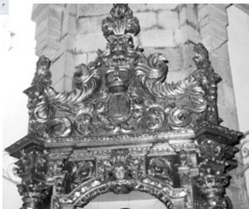
Fig. 3. ¿José y Ciprián Domínguez Bugarín?, retablo colateral de las clarisas, lado de la epístola, 1704 ca. Altar de S. Antonio de Padua, detalle del ático o copete.