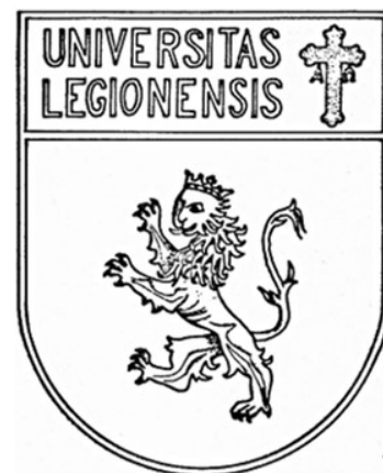
Fig. 8.- Facsímil en versión simplificada, utilizado en la publicación en el Boletín Oficial del Estado en el que se aprobaba, entre otros símbolos, el escudo-sello de la Universidad de León 14 .