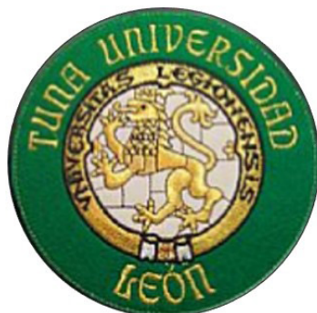
Fig. 17.- El diseño de García Zurdo ha sido muy utilizado y admitido en su función como identificador secundario de la Universidad de León.