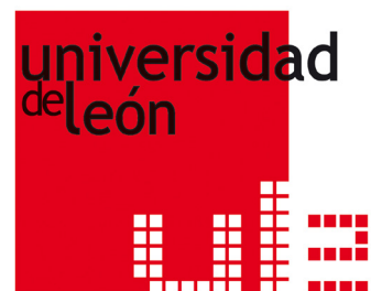
Fig. 15.- Marca de la Universidad de León, aprobada en el Manual de Identidad Corporativa.

Y en la primera etapa de la gestión del Rector Hermina se aprueba el Manual de Identidad Corporativa 12 , en el que se presenta la marca institucional (Fig. 15), distinguiendo logotipo y anagrama en diferentes versiones y colores, redibujando el escudo y su adaptación (Fig. 16).