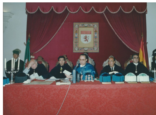
Fig. 9.- Primeras imágenes en forma de reposteros en las que se presentó el emblema de la Universidad de León para presidir algunos de los espacios más nobles de la institución académica (izquierda). Primera celebración de la festividad de San Isidoro el 5 de mayo de 1981 en el salón del Pendón de Baeza de la Basílica de San Isidoro (arriba).