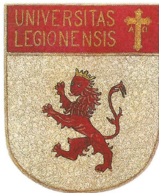
Fig. 7.- Modelo definitivo del escudo de la Universidad de León.

Pero de esta simplicidad surgen también los posibles equívocos al no identificar con certeza la Institución a que