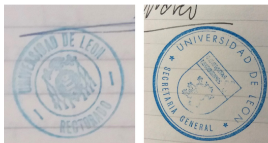
Fig. 10.- Sello institucional anterior y posterior a la aprobación del escudo de la Universidad de León por la Comisión Gestora.