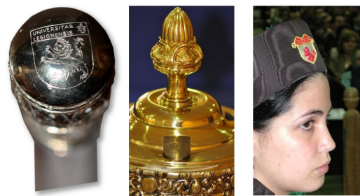
Fig.11 .- La vara del Maestro de Ceremonias y la maza institucional conservan el escudo original. El gorro del abanderado y los maceros, de la misma época, lucen un escudo de boca excepcional.