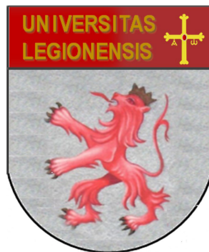
Fig. 4.- Propuestas presentadas para el escudo de la Universidad de León por el equipo del cronista Rey de Armas de Cadenas y Vicent.