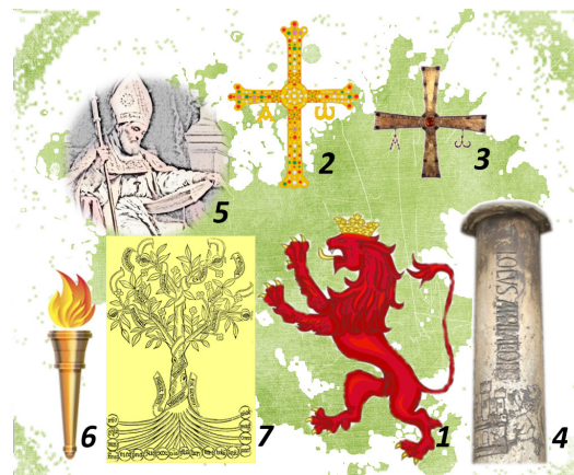
Fig. 3.- Recreación de las ideas propuestas por la Comisión para reflejar en el escudo: Emblema heráldico de León (1); Trasmisión de la Universidad de Oviedo a León (2 y 3); Ubicación de la Universidad (4); Patrono (5); En la Universidad se hace ciencia (6 y 7).