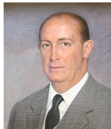
Fig. 2. -El genealogista y cronista Rey de Armas don Vicente de Cadenas y Vicent asesoró a la Universidad de León en la composición de su escudo institucional 13 .

Ante las múltiples opciones surgidas, la Comisión acordó contactar y solicitar asesoramiento al genealogista y cronista Rey de Armas don Vicente Francisco de Cadenas y Vicent (1915-2005) (Fig. 2), al que se enviaron varios bocetos que trataban de reflejar las ideas fundamentales que deberían quedar bien explicitadas en el escudo, con la finalidad de que valorara las propuestas y marcara pautas definitivas. Entre esos símbolos se sugerían: el emblema heráldico de León, la transmisión de la Universidad de Oviedo a León (representada por las armas de la cruz de la Victoria y de Ramiro II) y si fuese posible algún motivo alegórico a la ubicación de la Universidad (Locus Apellationis) o al patronazgo