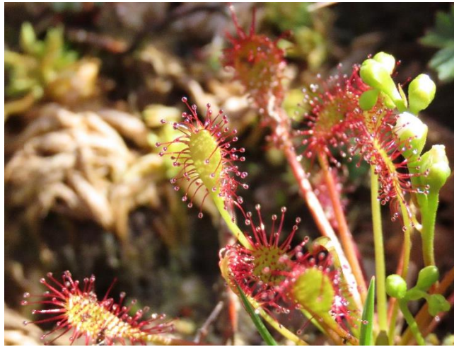
Fig.4.Fotografía de Drosera intermedia tomada por William Suárez Marques en Asturias.

obtusos. Sus pétalos son de 4.5x 3-3,5 mm, obovados. Presentan fruto de 3-4 x 2,5-3 mm, de subgloboso a piriforme, liso. Sus semillas de aproximadamente 1 mm, son tuberculadas, de un ceniciento obscuro.