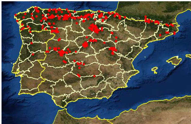
Fig. 6. Mapa en el que se muestra la distribución de Drosera rotundifolia en la Península Ibérica, obtenido de Anthos.es.