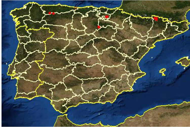
Fig. 5. Mapa en el que se muestra la distribución de Drosera longifolia en la Península Ibérica, obtenido de Anthos.es.