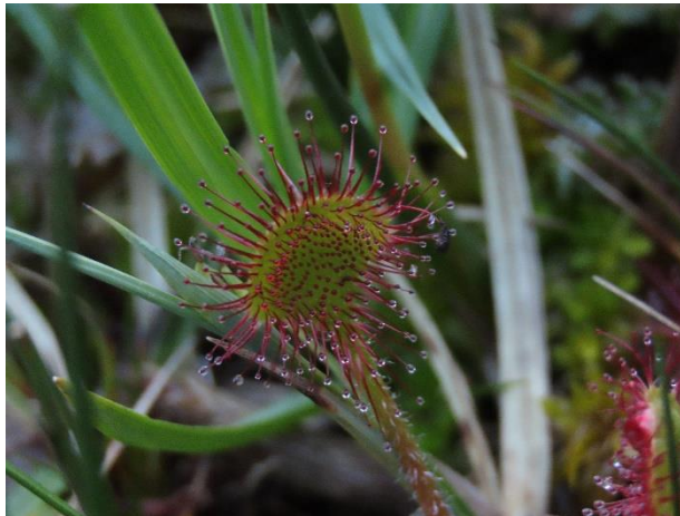
Fig.2. Fotografía de Drosera rotundifolia tomada por William Suárez Marques en León.