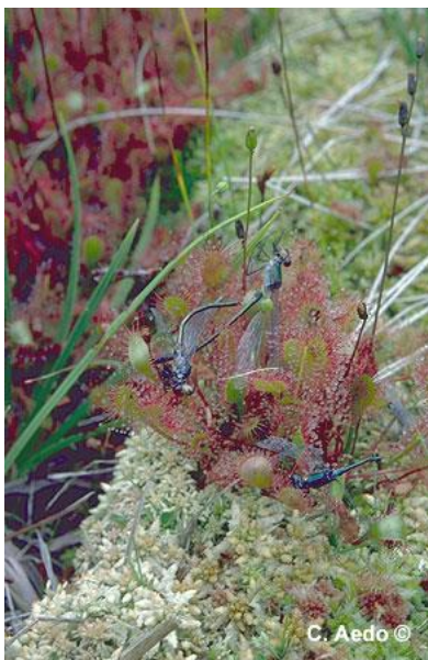
Fig.3.Fotografía obtenida de Anthos.es tomada por C. Aedo en Asturias.