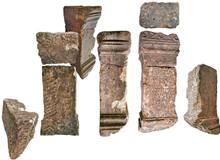
FIG. 1 - Distintas ángulos.