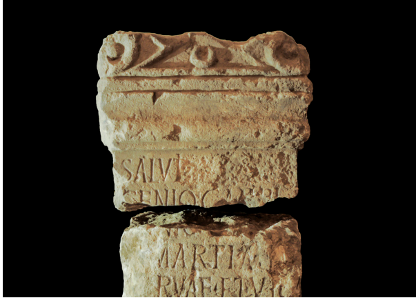
FIG. 3 - Detalle de la cabecera y primeras líneas.