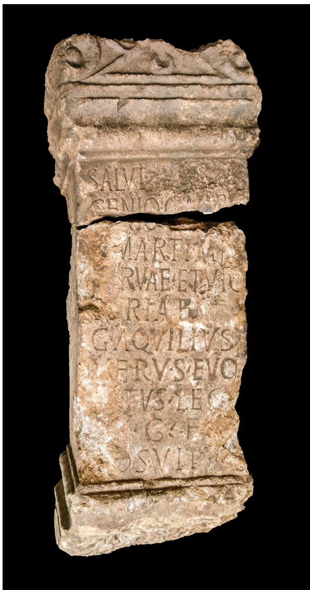
FIG. 2 - Vista de conjunto.