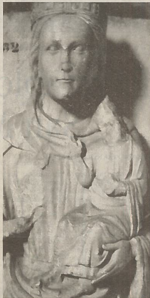
J. CABALLERO CHICA

Una de las estatuas es una figura masculina que magnifica la figura del «Cristo Majestad»