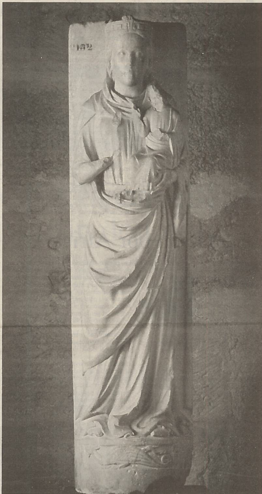
J. CABALLERO CHICA

Por otra parte, los dos personajes estudiados aparecen coronados. La forma de la corona hace depender ésta del simbolismo del círculo. Por lo tanto entraña una relación con el Orden superior. Al colocarse en la cabeza, la parte más noble del cuerpo humano. Se evidencia su función de nexo en-