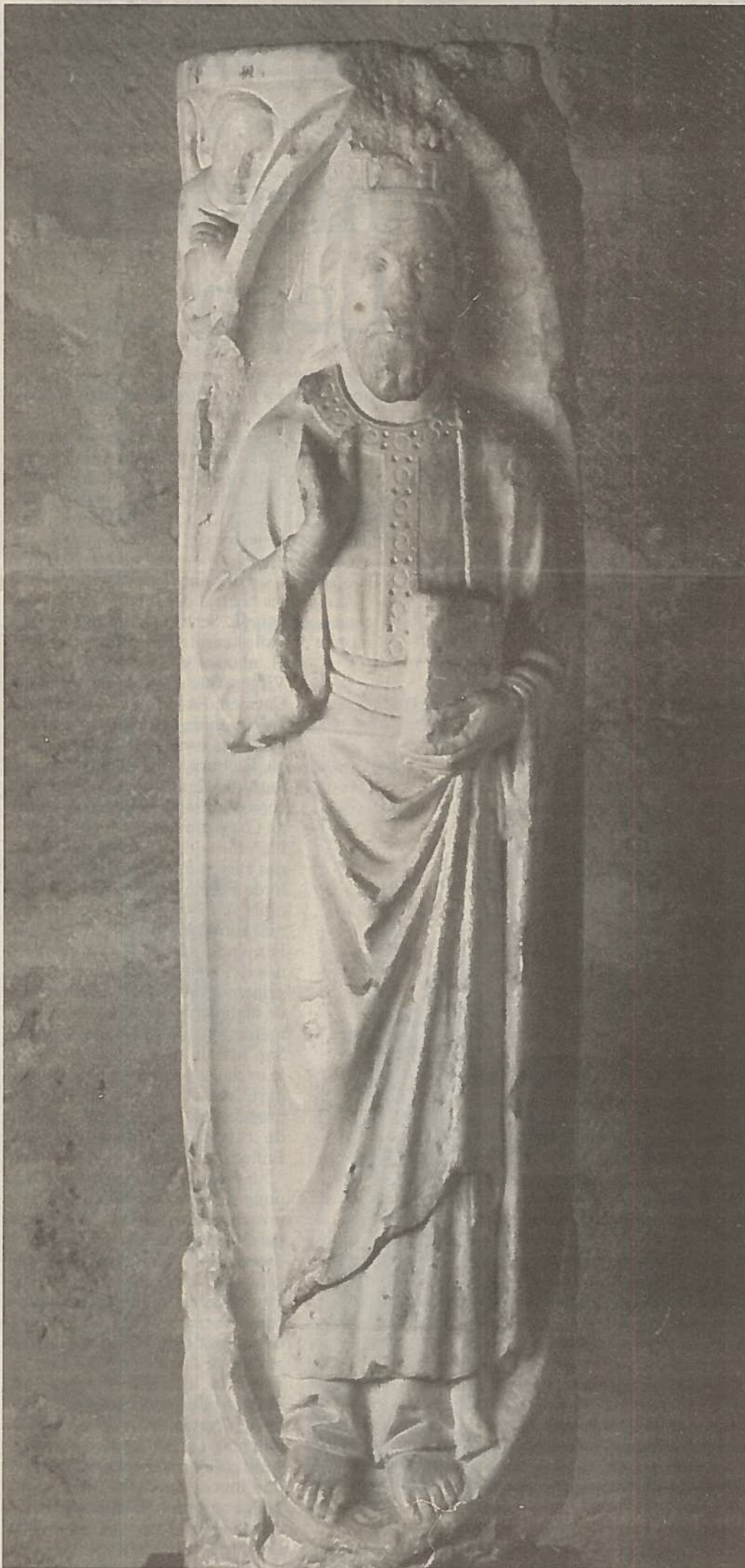
J. CABALLERO CHICA

La significación histórica que ha tenido el Monasterio de los Santos Facundo y Primitivo de Sahagún desde el punto de