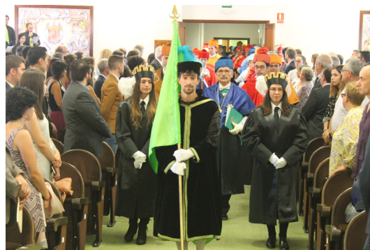
Fig. 5.- El cortejo será dirigido por el Maestro de Ceremonias, tras la autorización del Rector, e irán todos los profesores cubiertos con el birrete.

Al llegar el cortejo al lugar donde haya de celebrarse el acto, los miembros se situarán a ambos lados y a todo lo largo del pasillo principal para rendir los honores a los de mayor precedencia y categoría, lo que coloquialmente se conoce como la “vuelta del calcetín” (Fig. 6 y 7). A medida que