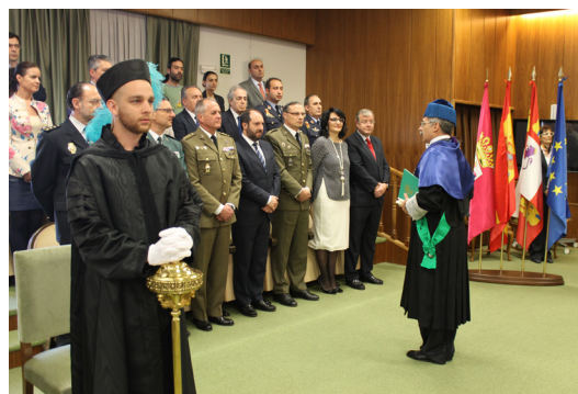
Fig. 11.- El Maestro de Ceremonias saluda a las autoridades no académicas y les da la bienvenida en nombre del Rector y de toda la comunidad universitaria.