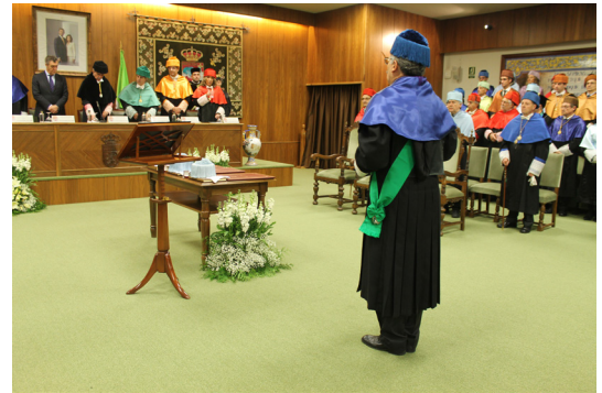
Fig. 12.- El Maestro de Ceremonias saluda al Rector, indicando que se puede proceder con el acto académico solemne.

El Rector, o quien presida el acto, hará uso de la palabra de pie, cubierto y desde su sitio, sin que en esta ocasión deba desplazarse el Maestro de Ceremonias. Toda persona que, siendo profesor, deba hablar en el acto, lo hará cubierto, pero sin guantes.