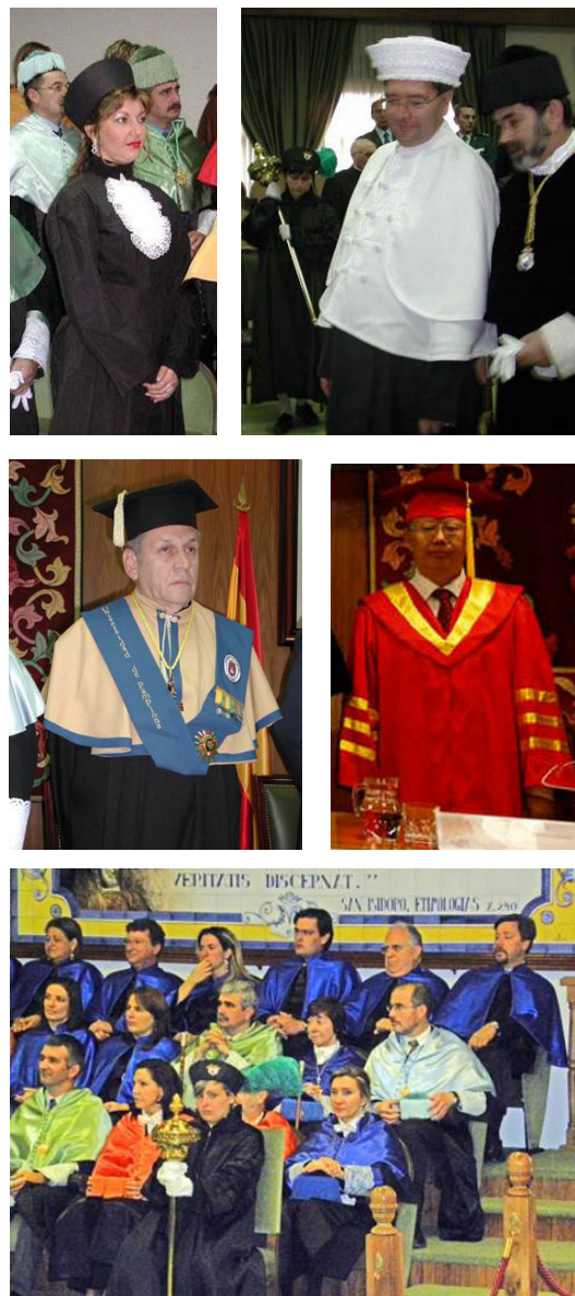
Fig. 4.- Los profesores invitados ocuparán el lugar correspondiente en su respectiva categoría.

Para un mismo nivel de grado académico no se tendrá en cuenta la antigüedad del centro al que pertenecen los profesores ya que, de acuerdo con la nueva estructura universitaria, se considera al Departamento como unidad básica docente, y cada profesor puede impartir docencia en titulaciones de diferentes centros, por lo que, dentro de cada categoría profesional, los miembros se agruparán de delante hacia atrás, quedando los más modernos a la cabecera del grupo que corresponda. Los Profesores invitados ocuparán el lugar correspondiente en su respectiva categoría (Fig. 4). Los Directores de Escuela, Decanos y Vicerrectores se agruparán dentro de su respectiva categoría de delante hacia atrás, por orden inverso a la antigüedad en el supuesto de los Centros, y al orden establecido en la prelación en el caso de los Vicerrectores. El Rector ocupará el último lugar en