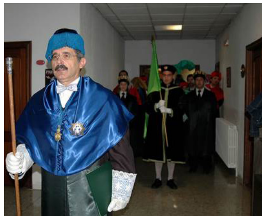
Fig. 2.- La organización del cortejo académico queda bajo la dirección del Maestro de Ceremonias.