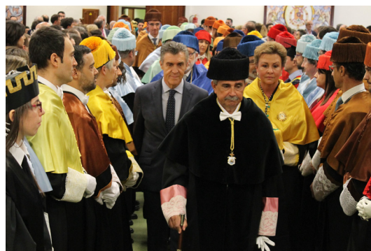
Fig. 6.- Dos momentos del pasillo de honor y homenaje a los de mayor precedencia y categoría.