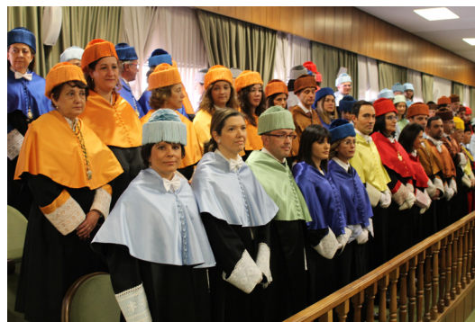
Fig. 8.- Los participantes en el cortejo académico permanecerán de pie y cubiertos en su posición (excepto los doctores que serán investidos en esa ceremonia) hasta que tome asiento la autoridad que presida el acto académico.

Una vez colocados todos los académicos en sus puestos, el Maestro de Ceremonias ordenará a los oficiales de protocolo que ocupen sus lugares (Fig. 9). La bandera de la Universidad de León en posición simétrica a la insignia nacional y el Abanderado a su izquierda. A ambos lados de la mesa presidencial quedarán los Ujieres y los Maceros, uno delante de las autoridades académicas, y otro delante del resto de autoridades (Fig. 10).