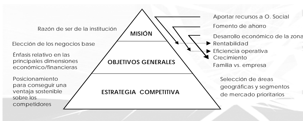
Figura 1: Interrelación entre la misión, los objetivos y la estrategia de las Cajas de Ahorros

Fuente: Elaboración propia a partir de Ballarín (1991)