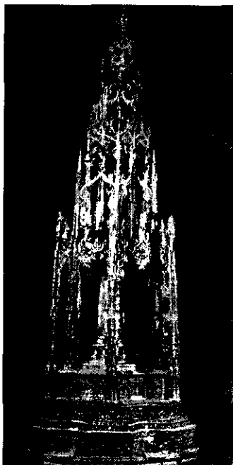
Fig. 1.— Custodia procesional de Córdoba.