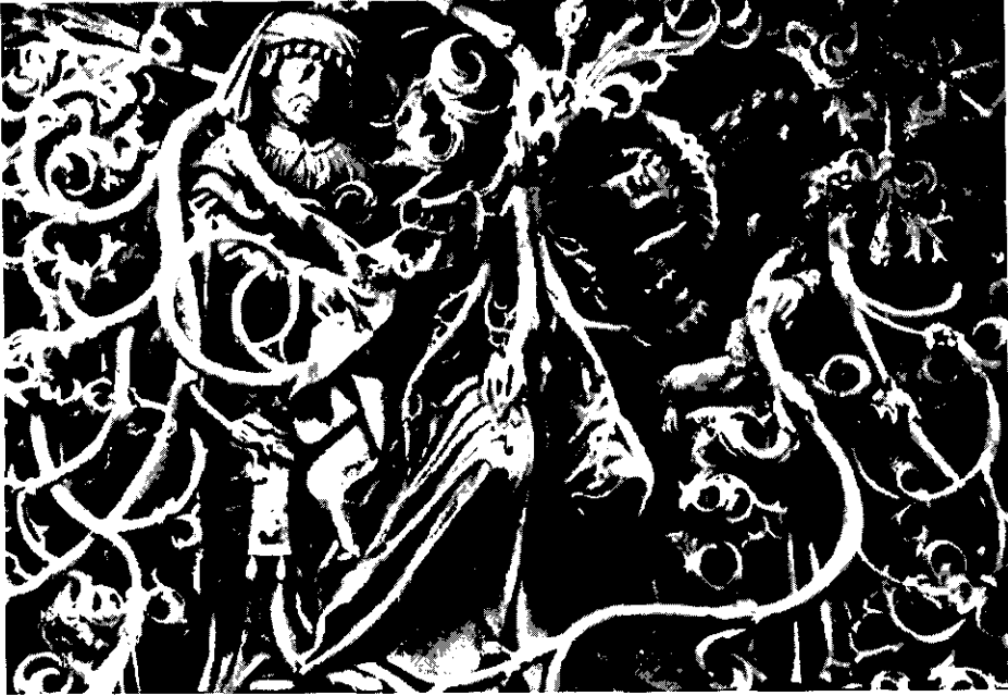
Fig. 3.—Detalle de la representación del «Arbol de Jessé» en la custodia cordobesa.