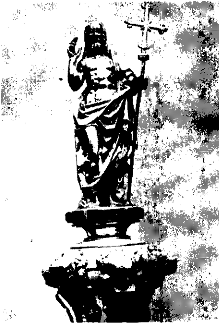
Fig. 4.—Imagen de Cristo resucitado.