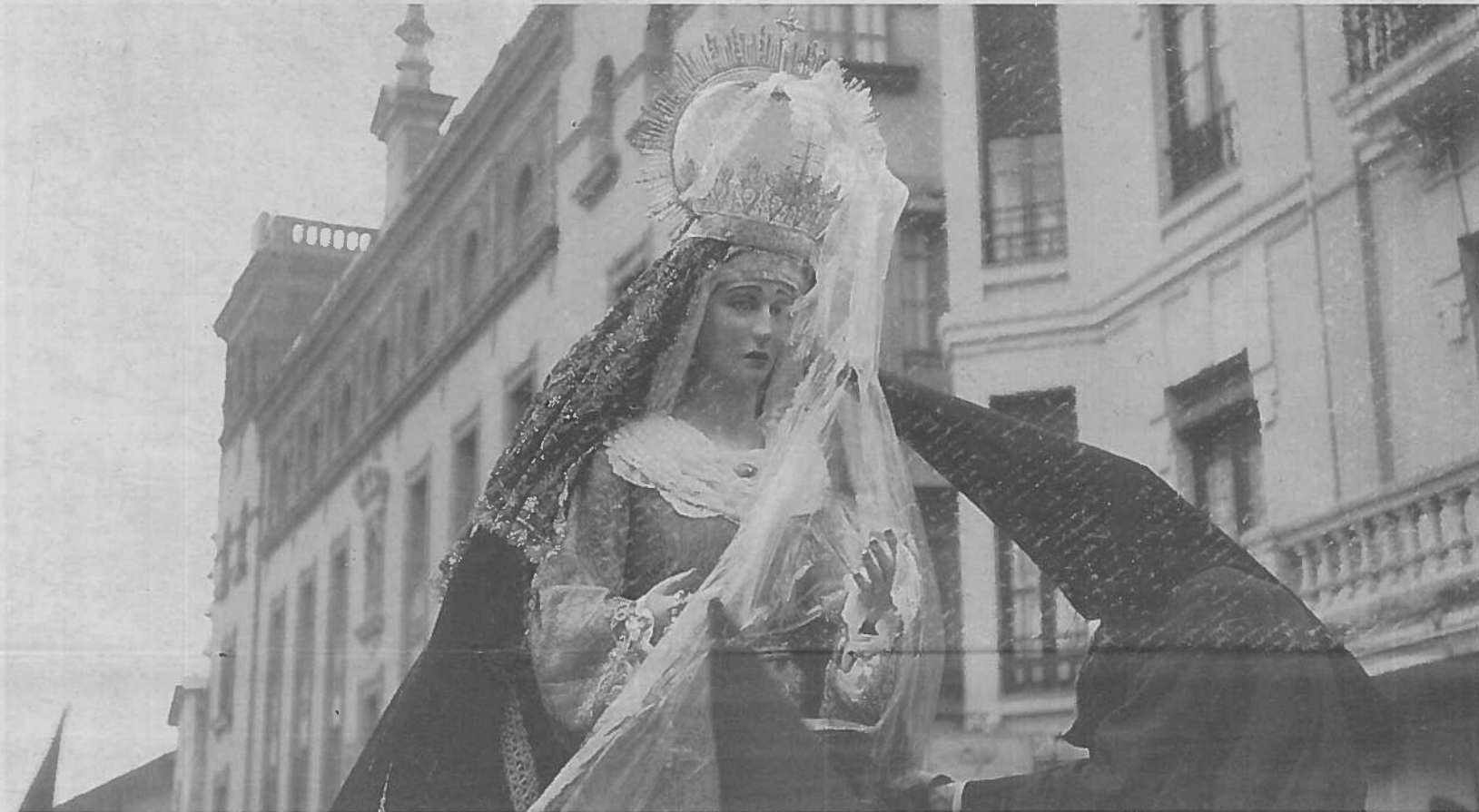
Virgen del Desconsuelo, Jesús Azcoytia, 1998

Otro apartado destacado dentro del estudio protocolario de la cofradía es el destinado a la asamblea general ordinaria siendo el órgano de gobierno por excelencia de la orden. Se celebra el domingo anterior al Domingo de Ramos con la lectura y aprobación del acta de la sesión anterior, estando compuesta la mesa de la asamblea por cinco miembros de la Junta de Seises, siendo obligatorio la asistencia del Hermano Mayor, secretario y tesorero.