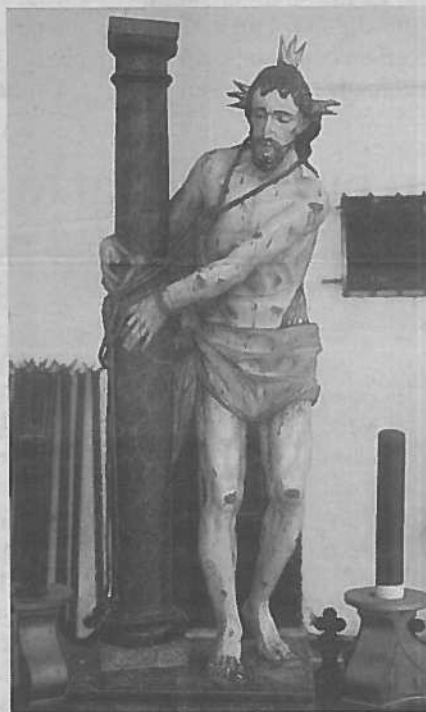
J. CABALLERO CHICA

Los siguientes acontecimientos de la cofradía marcados en su manual proto-