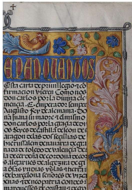
• Figs. 2 y 3. Carta de Privilegio para la venta de las casas de Hernando de Ávalos , 1526. Orla iluminada junto a la letra capital de introito, fol. 1r. Archivo del Convento de San Antonio de Toledo.