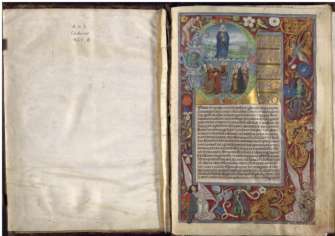
▪ Fig. 1. Fundación del mayorazgo del marqués de Villena , Diego López Pacheco, 1515. Archivo Histórico Nacional, Sección de Manuscritos: CÓDICES, L.921.

años condujo a una heterogénea presencia de ambas fórmulas, lo que se hizo evidente tanto en aquellos códices encargados por las elites eclesiásticas o la monarquía, como en aquellos otros de uso más restringido, cuyos destinatarios pertenecían a una escala inferior de la nobleza. En este último conjunto, de variada tipología y contenido, incluimos la Carta Privilegio para la venta de las casas de Hernando de Ávalos , fechada en 1526, donde se advierte un trabajo de iluminación menos esmerado que en aquellos contemporáneos destinados a las sedes episcopales, al rey o la alta nobleza, por lo que consideramos que, junto a las más distinguidas figuras de la miniatura de finales del siglo XV y principios del XVI, existió un número no menor de amanuenses que ejercían, en ocasiones, como iluminadores 24 , todo ello con el fin de