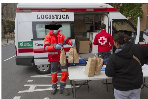
3. Reparto de bolsas de alimentos.

Viviendo de la caridad. En esta categoría los alumnos reflexionaron sobre cómo a causa de la pandemia, muchas familias se habían quedado sin empleo, por tener que estar confinados y/o por quiebra de negocios al no ser rentables. Este hecho trajo como consecuencia que no contaran con recursos económicos suficientes para poder satisfacer sus necesidades básicas, entre ellas, la de alimentación. En las imágenes 3 y 4 se muestran el reparto de bolsas de alimentos destacando una gran cola de personas para la recogida.