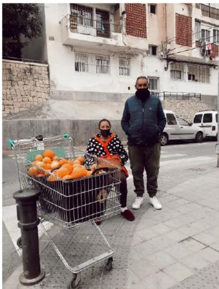
2. .Venta ambulante en la calle. Desaparece mercadillos