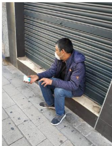
2. Venta de pañuelos

Viviendo de la caridad. En esta categoría los alumnos reflexionaron sobre cómo a causa de la pandemia, muchas familias se habían quedado sin empleo, por tener que estar confinados y/o por quiebra de negocios al no ser rentables. Este hecho trajo como consecuencia que no contaran con recursos económicos suficientes para poder satisfacer sus necesidades básicas, entre ellas, la de alimentación. En las imágenes 3 y 4 se muestran el reparto de bolsas de alimentos destacando una gran cola de personas para la recogida.