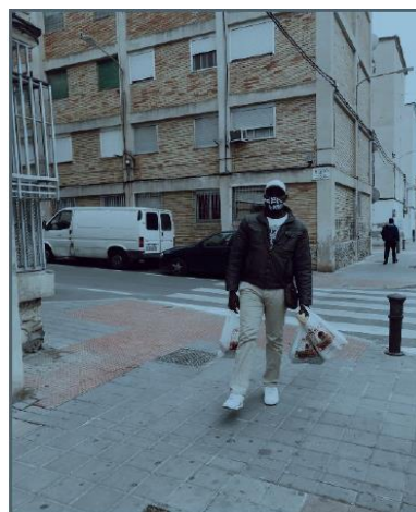
4. Recogida de alimentos

Sin hogar. Dentro de esta categoría los alumnos destacaron el volumen elevado de personas que habían encontrado durmiendo en la calle, sin hogar, destacando una mirada que hasta ese momento no se había desarrollado.