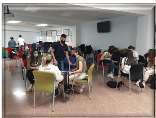
Debate en el aula

A continuación, se exponen las imágenes correspondientes al debate en aula y la exposición de foto-forum