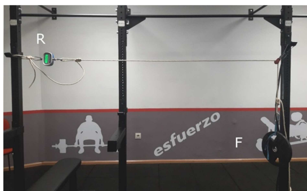
Figura 1. Ejemplo del funcionamiento de una polea fija. R, resistencia; F, fuerza.

cualquier elemento fijo que se encuentre en el centro y que no genere excesivo rozamiento ( e.g. ; el lateral de un radiador o una columna), ubicando una determinada carga en uno de los extremos de la cuerda ( e.g. ; 10 kg) y un dinamómetro en otro (Figura 1).