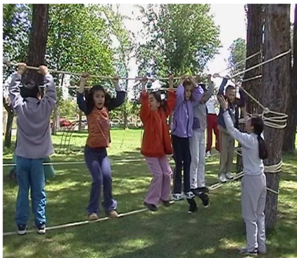
Figura 6. Realización en parque, en un entorno extraescolar.

Para finalizar, de manera opcional desde la materia Educación Física, pero no por ello menos interesante educativamente hablando, se podrían aplicar estos conocimientos y aprendizajes en un proyecto de generación de disfrute y de aproximación a las actividades al medio natural del alumnado de infantil y/o primaria. Esto se podría llevar a cabo en una visita a un centro de primaria de referencia del centro de secundaria para realizar un servicio con la intención de aproximar las actividades en el medio natural al entorno escolar o en las jornadas de puertas abiertas que algunos institutos realizan algunas veces para el alumnado de los centros de primaria de referencia (Figura 6).