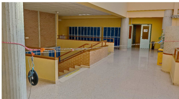
Figura 3. Ejemplo de una polea móvil con cuerda estática y carga de 10 kg.

un elemento fijo de la clase o del centro ( e.g. ; un radiador o una columna) mediante un nudo de as de guía. A continuación, se ubica el dinamómetro, una polea fija (que deberá asegurarse a otro elemento fijo), y una polea móvil (en el caso de que no se disponga de una polea móvil también podría realizarse un nudo de siete y medio). Por último, se coloca otra polea fija tras la que se ubicará una determinada carga ( e.g. ; 10 kg) (Figura 3).