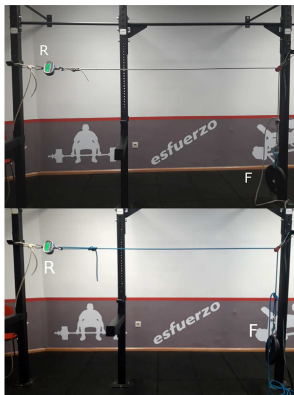
Figura 2. Ejemplos de mediciones realizadas en polea fija con cuerda estática, y dinámica, respectivamente.

tensión para una misma carga. De esta forma, para cargas de 10, 20 y 30 kg, se obtienen datos de 7.4, 14 y 21.2 kg, respectivamente. Por lo tanto, los alumnos podrán comprobar cómo los datos reflejados se asemejan en menor medida a los obtenidos de forma teórica que con la cuerda dinámica.