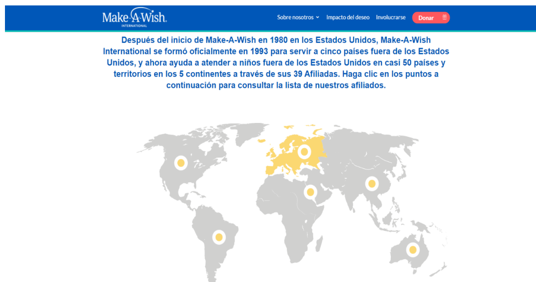
Figura 28. Pantalla de inicio de la página web oficial de Make-A-Wish/International.