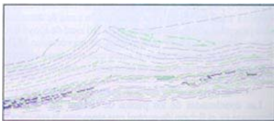
Mapa 2: Curva de nivel

Se pudo constatar un buen comportamiento, tanto del equipo GPS - Glonass, como del software empleado (SURVEYPRO ©Tripod Data Systems, Inc.), se mostró muy eficaz tanto en la recepción de las señales de satélite y radio, como en la colección de datos a la precisión fijada. La agilidad en la toma de datos y la precisión de los mismos convierten este sistema en un eficaz procedimiento para el seguimiento de la dinámica de playas o arenales. Lemas de conocer cuales son las zonas de acumulación o disminución de los depósitos de arena, este método permite valorar cuantitativamente estas variaciones gracias a la elaboración de Modelos Digitales del Terreno en dos periodos de tiempo distintos, entre los que interesa conocer éstas.