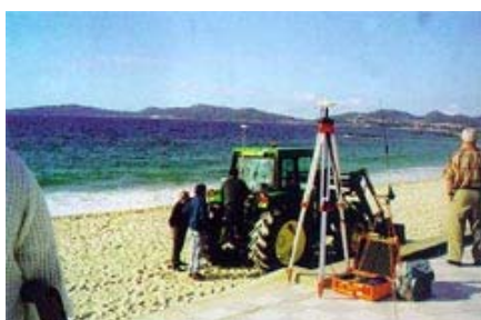
Foto2: Fijación de la antena receptora y rover sobre al vehículo

Desarrollar una forma de trabajo, que con los datos tomados en campo nos permitan elaborar un Modelo Digital del Terreno (MDT), en arenales utilizando equipos GPS, sobre el que se podrán realizar diversos estudios.