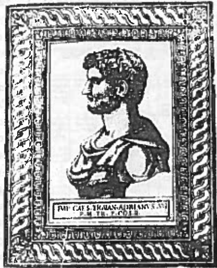
Grabado del emperador Adriano procedente del libro de Ciccarelli

Obra excepcional es el libro de Antonio CICCARELLI sobre los emperadores romanos, 7 en su afán de alagar a los poderosos de la época incluye a Maximiliano, Carlos V, etc. El interés del libro de Ciccarelli puede contemplarse desde distintos ángulos; diremos aquí que los valiosos grabados realizados con los retratos de los emperadores ofrecen un realismo próximo a la caricatura y que el libro resultaría todavía útil para catalogaciones de diverso tipo (estatuas, monedas, etc.).