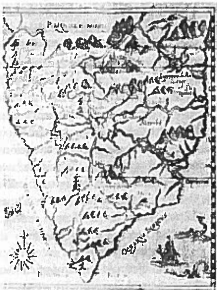
Localización de las fuentes del Nilo por Kircher

El siglo XVIII, con sus luces y sombras, ofrece por igual cambios y continuidades en los estudios clásicos. Obras de erudición como las de Samuele PISTICO o P. CARPENTIER, 12 ilustran esa continuidad con la erudición renacentista. P. Carpentier acomete el estudio sobre el sistema de escritura taquigráfica romana que lleva el nombre del liberto de Cicerón que recogía sus discursos, aunque este sistema era conocido de antes. El trabajo parte de considerar que se trata de una escritura secreta, visión que permanece hasta el siglo XIX, cuando se demostrará su verdadera naturaleza.