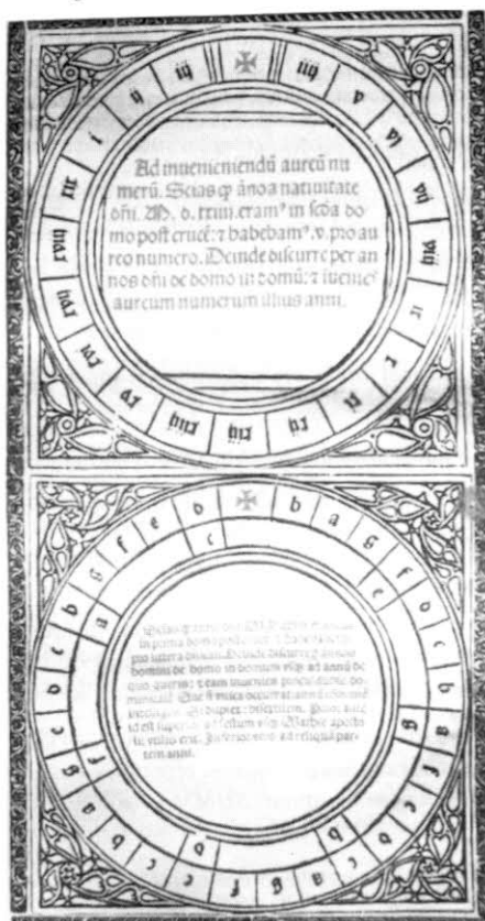
Figura 1. Calendario del Misal, folio 8.