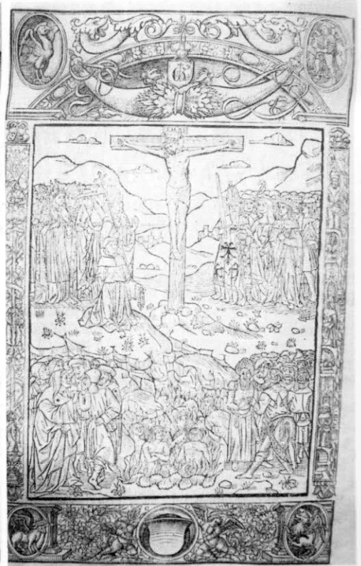
Figura 6. Gar Calvario de Andrés de Li.