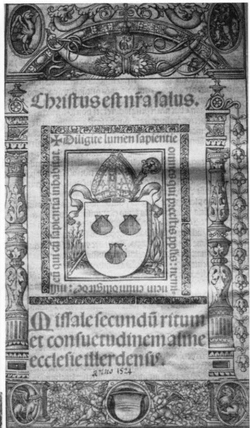
Figura 3. Portada del Obispo Conchillos.