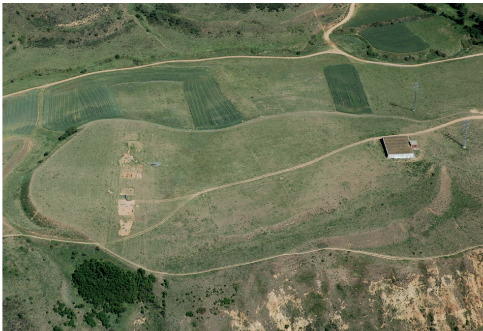
Fig. 2. Castro de los Judíos. El espacio habitado se evalúa sobre la cota de los 860 metros. Sin embargo, la detección magnética parece señalar varias zonas despobladas: el entorno de la fortaleza, la posible ronda de la muralla y varios puntos aislados del interior.

De forma que considerando la superficie de 2'32 hectáreas multiplicada por esa media de 150 habitantes/ha nos proporciona una cifra de 348 habitantes pero la estimación podría alcanzar un techo de 464 habitantes si utilizamos el coeficiente máximo de 200 habitantes/hectárea. Es decir que el Castrum Iudeorum pudo contar con una población entre 348 y 464 habitantes. Para esta estimación teórica no consideramos la fortaleza y la cuantía al alza que supondrían sus efectivos militares porque ignoramos tanto la composición de esos efectivos como la estabilidad de su presencia. La cifra menor de 348 parece más verosímil si consideramos las zonas no habitadas de los ya aludidos análisis magnéticos llevados a cabo entre 2002 y 2003. 25