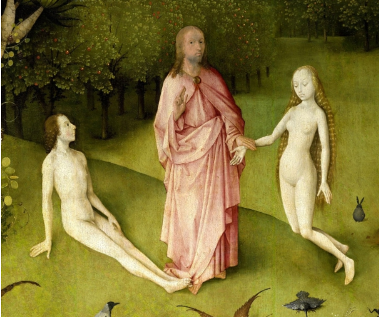
Jardín de las Delicias: Cristo, Adán y Eva (1480-1505), El Bosco