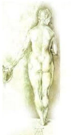
Figura humana. Alberto Durero, 1506

“Quien no aprecia a sus maestros será despreciado por sus discípulos”