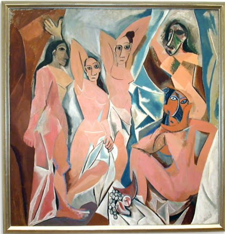
Las señoritas de Avignon. Pablo Picasso, 1907