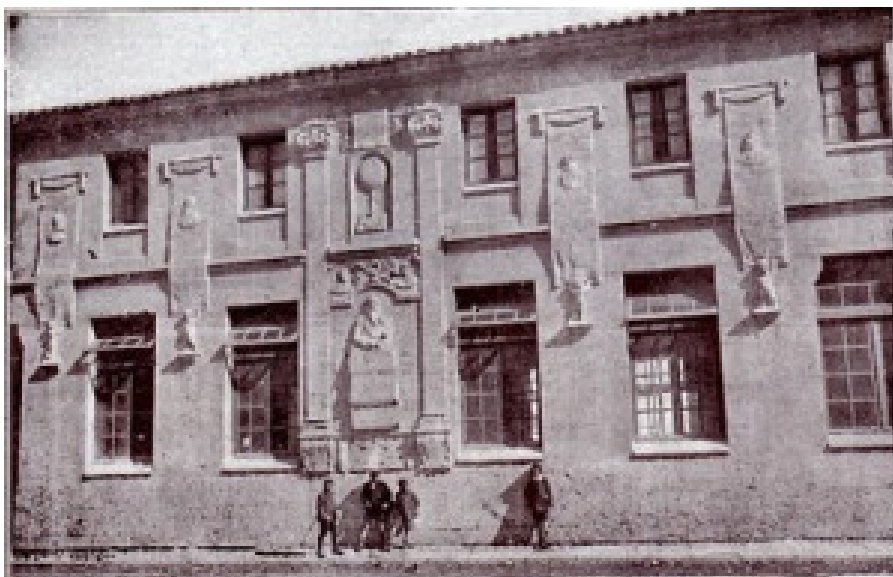
Escuelas Nacionales Julio del Campo en la calle de su mismo nombre en León (aportación del filántropo y cantero Julio del Campo Portas).