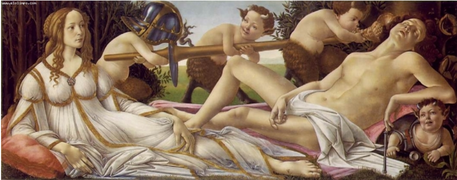
“Venus y Marte”. Botticelli (1.455). National Gallery, London 32