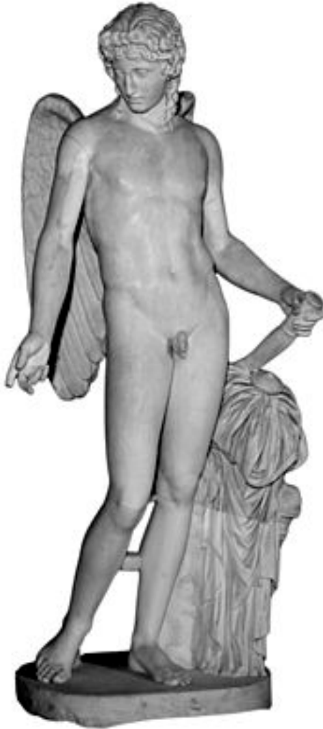
El Eros 2 Farnesio , estatua del tipo Centocelle (Museo Arqueológico Nacional de Nápoles, inv. 6335).