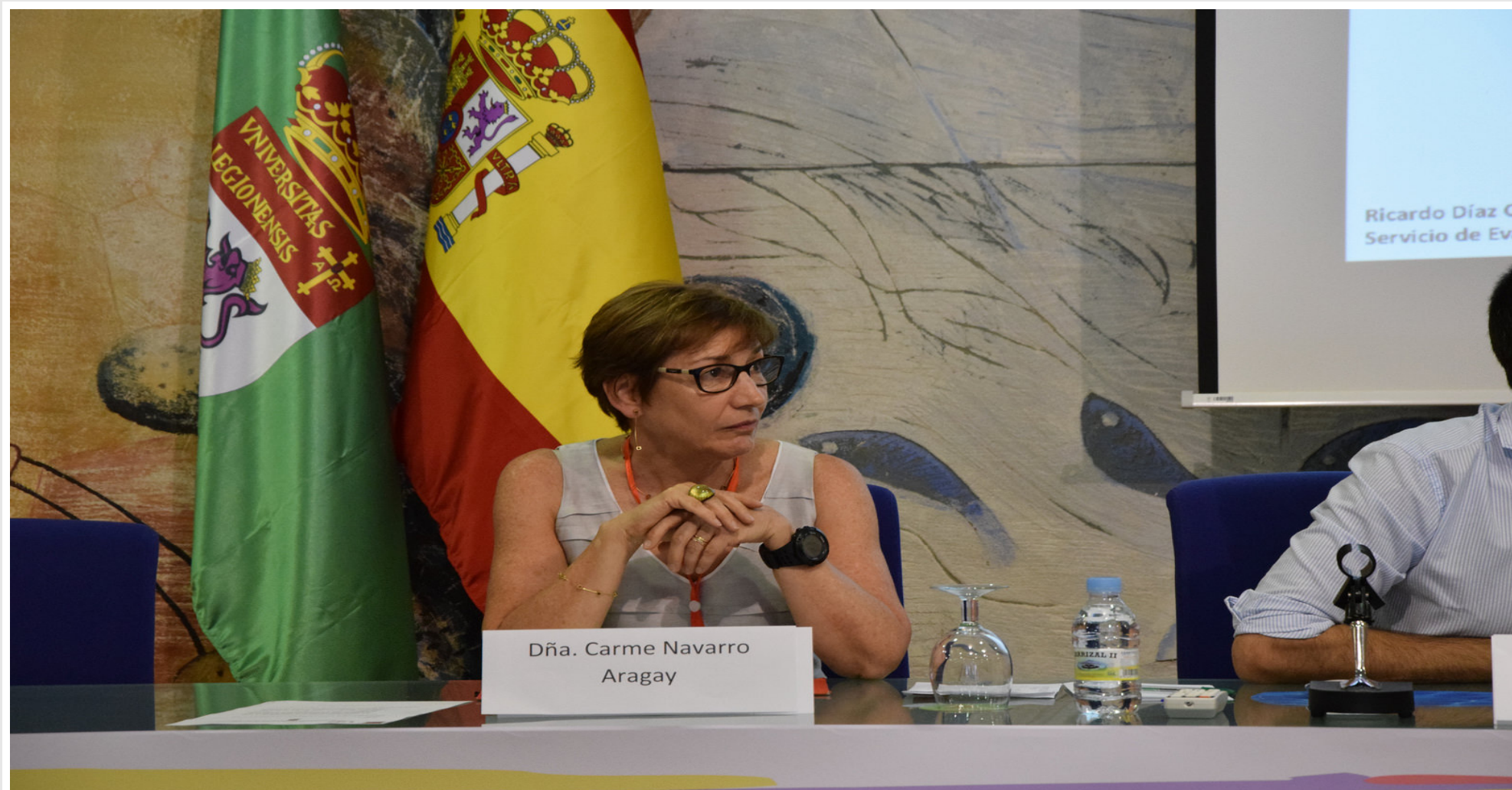
7 MONTHS AGO