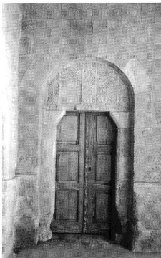
Actual puerta de acceso a la torre y "Panteón de los Abades" (Fot. Ángela Crespo Espinel).

torre) es la que, como hoy en día, permitía el acceso a la misma y la inscripción fundacional se encontraría "cubriendo el arco". Un espacio que sin embargo ahora, y a modo de tímpano, encontramos ocupado por un cancel (de 1,27 m de longitud) reubicado no sin cierta premura, con prisas, pues fue colocado en posición inversa a la original 23 . ¿Cuál fue su primitiva ubicación?, ¿tal vez en la "puerta del coro", en el "iconostasio", como sugirió Gómez Moreno: "... de entre las columnas del iconostasio, cuyas basas están mutiladas lateralmente, bue-