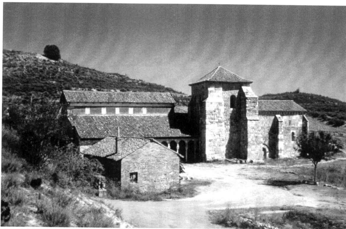
San Miguel de Escalada, vista general (Fot. Ángela Crespo Espinel).

de que consta la colección documental medieval de Escalada, tan sólo dos pertenecen a los siglos X y XI (940 y 1098) 4 ; pero gracias a los epígrafes y noticias conservadas en otras colecciones documentales catedralicias (León) y monásticas (San Benito de Sahagún) amén de las dispersas en otros archivos (parroquial de Escalada y diocesanos de León y Astorga principalmente) diversos autores 5 reconocen como tales a Adefonsus (¿?920?); Recesvindus (¿920, 937 y 940?) 6 ; Stephanus