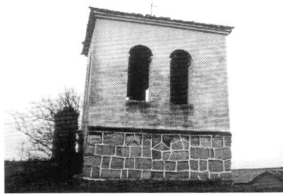
Campanario situado entre los barrios de San Miguel y Valdebesta: estado actual tras su dismantelación en 1963.

Si la conversión al Catolicismo y la restauración material motivaron, respectivamente, las reconsagraciones efectuadas entre los siglos VII y X, ¿qué las motivó en la undécima centuria? Todo apunta a la implantación de un ordo litúrgico foráneo 40 ; el hecho de que la restauración no tuviera lugar el " dia domini " 41 refleja la imposición de un nuevo ordo basado en una compila-