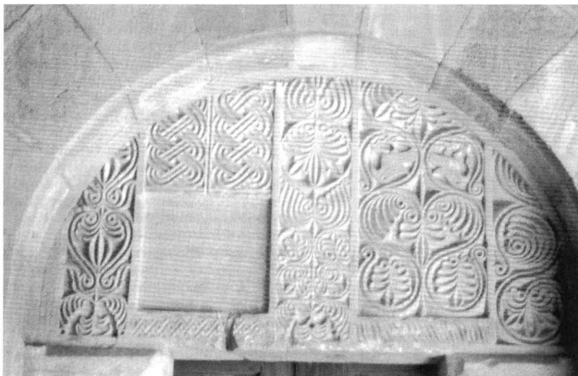
Detalle de la anterior: cancel reutilizado como tímpano.

cias relativas a la creación de la Comisión de Monumentos de León el 25 de enero de 1839 y a su reorganización por R.O el 13 de junio de 1844, figura de manera marginal el siguiente texto: "La lápida Hic locus está en la escalera de la campana ". La segunda contiene una pequeña reseña histórico-artística de San Miguel de Escalada acompañada de una sucinta bibliografía, la más reciente de 1898, y al final de la misma la siguiente observación: "La lápida Hic locus... está de peldaño en el campanario, entre los dos barrios del pueblo ". Y en la tercera, redactada en el reverso de una nota de índole contable con fecha de 3 de noviembre de 1919 31 , encontramos el siguiente texto: "En el campanario que hay en un alto entre los dos barrios, junto a la campana pequeña, la última piedra que sostiene los adobes está labrada como las del coro de Escalada y tiene indudablemente una inscripción".