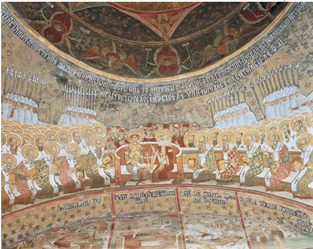
Fresco representando el Concilio de Éfeso

La Iglesia Copta nunca ha creído en el monofisismo en la forma en que fue retratado en el Concilio de Calcedonia. En este Consejo, el monofisismo significaba creer en que Jesucristo sólo tenía una naturaleza, la divina. Los Coptos creen que el Señor es perfecto en