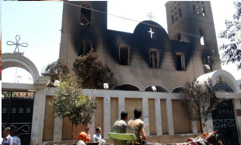
Protestas por la defensa de la religión copta y ataque a una iglesia de esta misma religión