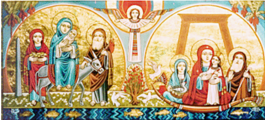
Representación del Nacimiento de Jesús según la Iglesia Copta