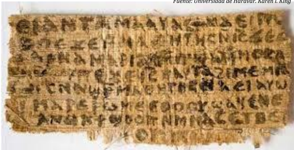
Papiro de escritura copta