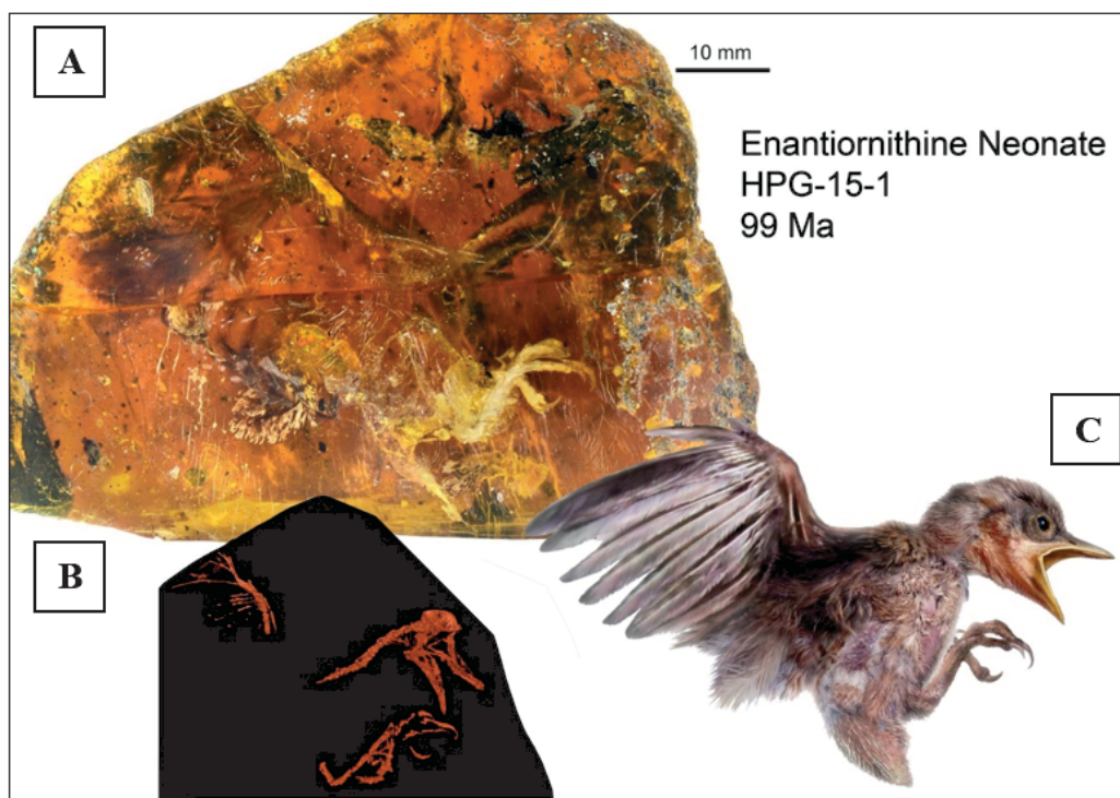
Figura 1. A) Pieza de ámbar fósil con restos muy bien conservados de un pollo Enantiornithine. B) Esquema detallado de los restos encontrados. C) Reconstrucción artística del pollo que quedó atrapado dentro de la resina hace unos 99 millones de años (tomado de Forssmann, 2017).

El ámbar ha sido un recurso fundamental en el conocimiento del pasado del planeta, pues en multitud de ocasiones se han encontrado en su interior pequeños animales o restos de plantas conservados en perfectas condiciones, manteniendo incluso partes blandas. Así, en el ámbar del Mesozoico se han encontrado en excelentes condiciones plumas y protoplumas de dinosaurios, colas de lagartos y pelos de mamíferos. Por otro lado, en el ámbar del Cenozoico (cuando la resina era más fluida y abundante), se han encontrado artrópodos e incluso pequeños vertebrados. Llamen especialmente la atención algunos artrópodos cubiertos de polen, o insectos hematófagos en cuyo tubo digestivo había nematodos parásitos de vertebrados, así como algunas aves pequeñas perfectamente conservadas ( Fig.1 ).