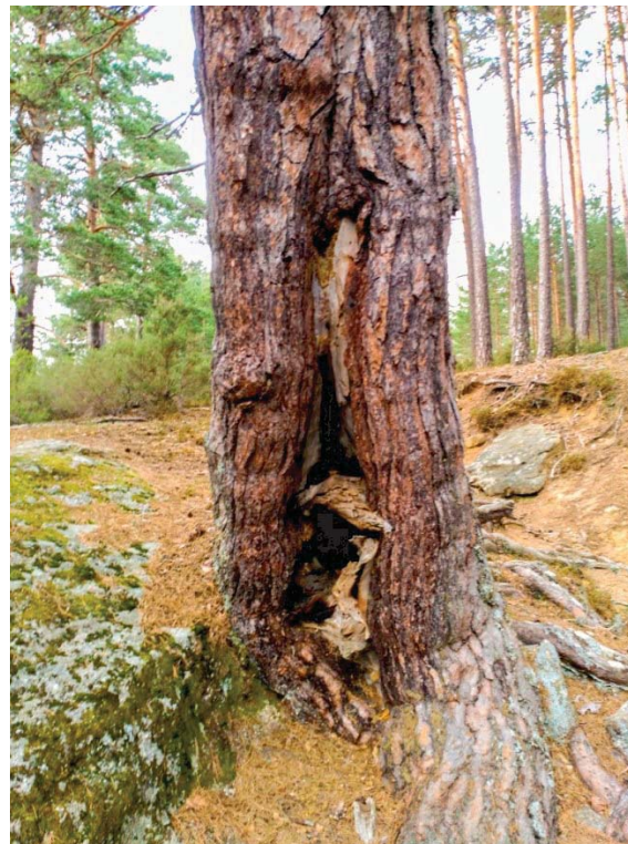
Figura 2. Ejemplar de Pinus sylvestris L. de Duruelo de la Sierra (Soria), con una peguera antigua en su base utilizada para sacar resina por medio del calentamiento del pino con fuego.

Su aprovechamiento por parte del hombre continuó con especial importancia a partir del siglo XVI para el calafateado de los barcos, gracias a la demanda de las grandes potencias marítimas como la española, la inglesa o la holandesa (Delgado Macías, 2015). Los países nórdicos eran los principales productores de resina ya que ésta se extraía tras calentar la madera o el propio pino por medio de pegueras ( Fig.2 ), sin tener que recogerse la exudada por los pinos vivos mediante heridas ( Fig.3 ) (Uriarte Ayo y Sebastián Amarilla, 2003). A principios del siglo XIX, la llegada de la construcción naval metálica provocó una decadencia en el uso de la resina como impermeabilizante (Coppen y Hone, 1995). Desde ese momento, gracias a la aparición de la industria química, la resina encontró un importante nicho industrial que ha mantenido hasta la actualidad. En esta industria se empezaron a utilizar los productos obtenidos tras la destilación de la resina: colofonia