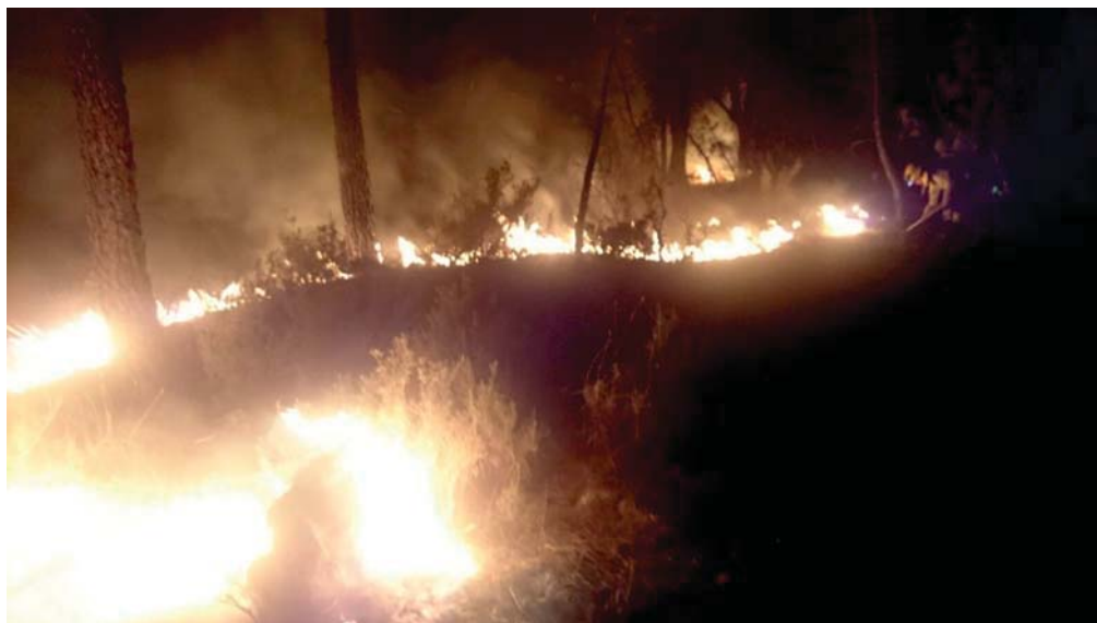
Figura 6. Fotografía de un incendio ocurrido en un pinar de pino resinero ( Pinus pinaster Ait.) de Cañamares (Cuenca).

Algunas estimaciones pronostican que en España se podrían producir, razonablemente, unas 45.000 t/año, aunque con una buena gestión sería factible que aumentara la producción hasta las 75.000 t/año. Esta planificación del aprovechamiento daría trabajo de manera directa a unos 6.000 resineros (Picardo Nieto y Pinillos Herrero, 2013). La temporalidad del oficio no podrá ser ampliada, puesto que los pinos requieren unas condiciones de calor para producir resina. De hecho, si se resinaran en invierno, se dañarían gravemente. Sin embargo, existen alternativas de trabajo para los resineros durante los meses fríos, como pueden ser los aprovechamientos forestales o los tratamientos silvícolas; prácticas que ya se están llevando a cabo en muchas comarcas con un exitoso resultado. Además, esta combinación de trabajo implicaría la conservación de nuestros pinares resineros, ya que desde su abandono, los devastadores incendios se han multiplicado considerablemente debido al aumento del combustible disponible ( Fig.6 ). Esto se ve reflejado en los datos peninsulares de los incendios forestales en la década 2000-2010, donde el número de incendios en pinares de esta especie ha supuesto el 27% total de los incendios ocurridos en toda España (Picardo Nieto y Pinillos Herrero, 2013). A estas cifras hay que añadir las 11 víctimas humanas ocurridas en el verano de 2005 en el incendio de la antigua zona resinera de Guadalajara que arrasó algo más de 10.000 ha.