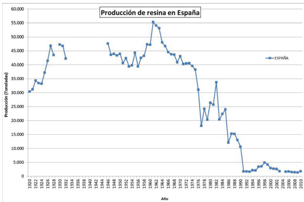
Figura 4. Producción de resina en España desde 1920 hasta 2010 (tomado de Picardo Nieto y Pinillos Herrero, 2013).

parición a principios de la década de los 90 ( Fig.4 ). La competencia con países menos desarrollados con gran potencial forestal, el auge del petróleo y el encarecimiento de la mano de obra provocado por el éxodo rural, provocaron que la resina española dejara de ser un producto económicamente competitivo a nivel mundial (Uriarte Ayo y Sebastián Amarilla, 2003). Este hecho trajo consigo grandes perjuicios a muchos pueblos españoles que dependían directamente del aprovechamiento de la resina (Perez et al. , 2013).