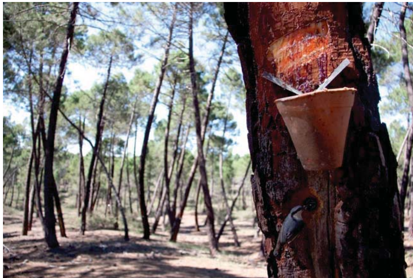
Figura 3. En la fotografía se muestra un nido de trepador azul ( Sitta europaea L.) en una cara antigua cicatrizada, justo por debajo de un recipiente que recoge la resina de la nueva cara trabajada por el método actual.

cara de los troncos. Dicho método es el que se mantiene en la actualidad ( Fig.3 ). El cambio en el procedimiento de obtención provocó que la producción se desplazara hacia países de zonas más cálidas del Mediterráneo y Norteamérica (Uriarte Ayo y Sebastián Amarilla, 2003).