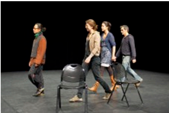
Figura 4. Satisfying lover de Steve Paxton (1967/2011).

Entre sus bailarines destaca, Steve Paxton quien coreografió Satisfying Lover en 1967, una pieza rompedora porque la confianza otorgada al cuerpo no se dirige solo al bailarín entrenado sino a todos los cuerpos: bailan profesionales con aficionados a partir de un material postural y motor básico: caminar, pararse, sentarse, levantarse, etc. (Fig. 4.). La introducción de la silla de ruedas en la escena constituirá un paso más allá de la ruptura con el canon de cuerpos y habilidades coreográficas. Steve Paxton formaba parte del activo colectivo de bailarines y coreógrafos de la Judson Church en Nueva York (Bannes, 2002). Este movimiento coreográfico de los setenta abrió la danza a lo desconocido e inesperado profundizando en la improvisación. Y desde los ochenta se desencadena, a su vez, la apertura a cuerpos distintos, incluidos los cuerpos con discapacidad. La experiencia de la danza se abre a un espectro más amplio de cuerpos, pero también a distintos planteamientos pedagógicos en un proceso de alteración imparable donde, no obstante, la inclusión se revela con dificultad o ambigüedad; según Albright (1997, p.68), ésta se aborda en ocasiones de forma superficial u ornamental, pues la moda de la integración, tanto en Europa como en América, corre el riesgo de convertirse en una cuestión políticamente correcta o de interés mercantil.