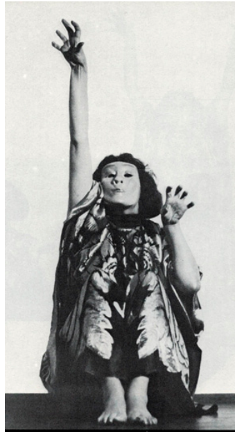
Figura 2. Mary Wigman en Exentanz (1914).