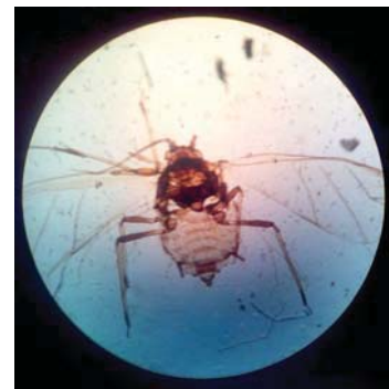
Figura 2. Hembra vivípara alada vista a microscopio óptico.

La primera parte del trabajo que realizamos consistió en la comprobación de la identificación taxonómica de una larga serie de hembras vivíparas aladas ( Fig. 2 ) —ya preparadas— que había sido recogidas mediante trampas en Salamanca. Utilizamos las claves de Seco Fernández y Remaudière, que no existían cuando se había realizado la identificación de esos especímenes hace años por una estudiante de la Universidad de Salamanca. Cada uno de los ejemplares fue identificado por varios de nosotros para comprobar que llegábamos a las mismas conclusiones y resolvíamos los problemas que se nos presentaban de una forma comparable.