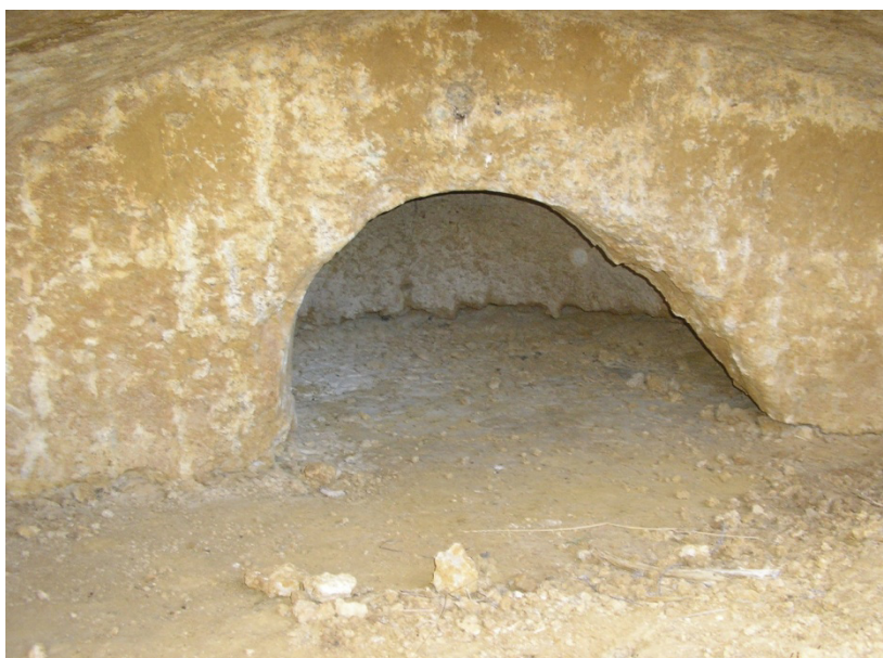
Ilustración 2. Arco de acceso al presbiterio de la iglesia de San Martín