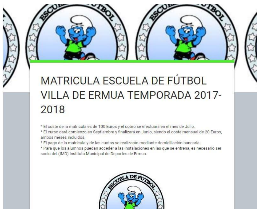
Figura 2: Imagen de la página principal del formulario de la matrícula de la Escuela Villa de Ermua para la temporada 2017-2018 (Ver anexo 1) ( https://goo.gl/forms/5gT0GhMFEeWCPqvQ2 )

Fecha de nacimiento, Nombre, Apellidos, Lugar de residencia, Número de teléfono fijo, Número de teléfono móvil, e-mail y Número de cuenta.