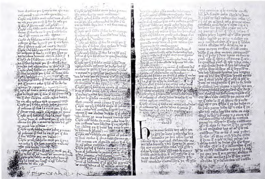
Comienzo del Libro Segundo del Libro de los Estados

traen a grandes dolencias et a menguar mucho la vida, et aún desean et fazen por el comer muchas cosas que les son dañosas a las almas et a los cuerpos... Otrosí, el beber ordenó Dios naturalmente para enralecer la vianda, por que pueda mejor moler el estómago et pueda pasar por las venas para govar et mantener el cuerpo, para umicar et enfriar et escaldar el cuerpo segund fuere mester. mas los omnes no beven sino por el plazer et por el sabor que toman en el beber, et fázelo en guisa que muchos toman grandes yerros en los entendimientos, para fazer muchas cosas que no son servició... Otrosí, en el e[n]gendrar de los fijos ordenó Dios naturalmente, por que pues los omnes non pueden dura[r], que finquen los fijos para mantener el mundo et para que Dios sea servido et loado dellos. Mas muchos omnes non lo fazen por esta entención, sinon por el plazer et por el deleite que toman en ello, et fazen todo el contrario de aquello para que nuestro señor Dios ordenó el e[n]gendramiento..."; L. Estados , I, LII.