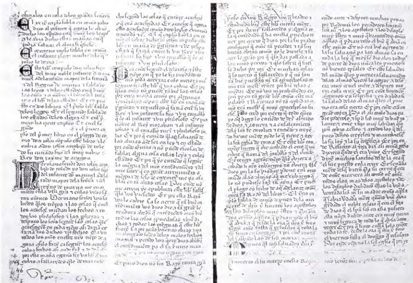
Comienzo del Libro Primero del Libro de los Estados

más de la obligación de conservar el estado que le fue otorgado, contribuyendo con ello a mantener el orden social establecido, la posibilidad de conciliar la caballería —al fin y al cabo, una forma de exaltación corporal— y la fe en el proyecto cristiano de salvación del alma.