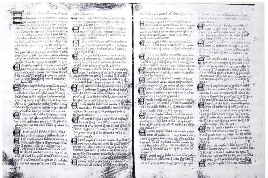
Parte del índice del Libro de los Estados

destreza y vigor, si bien están ya presentes en la producción literaria caballeresca que surge en Europa a partir del siglo XII, en torno a la Primera Cruzada, se convierten en un lugar común de la producción literaria del Bajo Medioevo, especialmente de la prosa didáctico-moral de la que es representativo, en el contexto castellano, Don Juan Manuel. Se trata de una novedosa atención al cuerpo que, si bien pone de relieve el carácter corporeista de la racionalidad medieval, no deja de mostrar muchos de los elementos de un discurso culto tradicional elaborado contra la carne ; unos elementos condu-