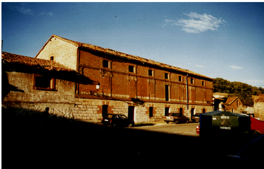
Figura 2. Edificio catalogado por el PECH de Burgos con el grado de protección ambiental.

La Protección Integral permite únicamente las actuaciones de conservación dado el interés en mantener el valor histórico-artístico de los edificios y la obligación de no modificar las condiciones referentes a fachadas, estructuras, organización interna, composiciones de color, ornamentos o cubiertas. Bajo esta norma de protección se ha englobado a edificios singulares en el suroeste de la ciudad como la Ermita de San Amaro, el Arco de la Villa, el Arco de la Plaza del Compás, la Iglesia de San Antonio en el barrio de Huelgas, la puerta Este del Parque del Parral y, obviamente, el propio Monasterio de las Huelgas y el edificio del Hospital del Rey.