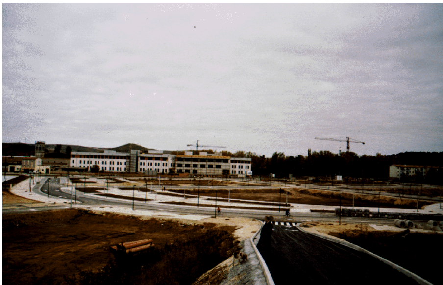
Figura 1. Plan Parcial “Parral” y Plan Parcial “Sedera” en el suroeste de Burgos.