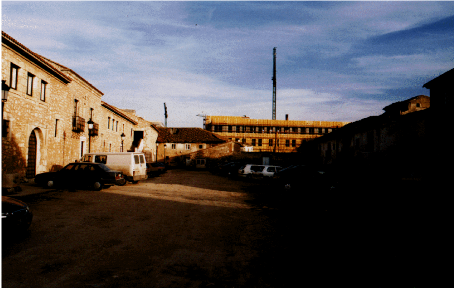
Figura 3. Transformación del conjunto tradicional denominado “Plaza del Sobrado”.