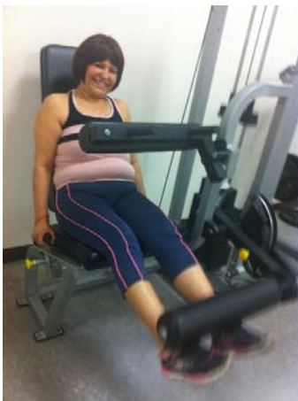
Figura 1. Ejercicio de extensión de pierna ( legg extencion )

El entrenamiento progresivo consiste en trabajar en cada sesión el ejercicio de prensa de pecho sentado en la máquina EXM2500S marca Body Solid, el ejercicio de extensión de pierna se trabaja en la máquina DX-2-8019 Extensor de pierna/isquiotibial combo marca Dinamax Pro by Muscle dynamics. Se realizan dos sesiones por semana con un día de descanso entre cada sesión.