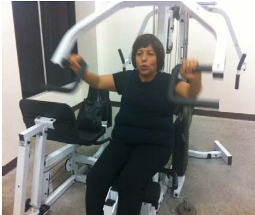
Figura 2. Ejercicio de prensa de pecho

Cada sesión tiene una duración de 50 minutos, con 30 minutos de bicicleta estacionaria modelo RC-30 y RC-40 marca Horizon Fitness,