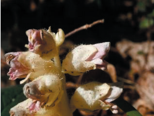
Figura 2. Detalle de la inflorescencia de L. squamaria

en Navarra (Aizpuru et al. , 1987) y La Rioja (Alejandro, 1995). Los límites de su área de distribución sitúan este taxon en dos núcleos aislados; la localidad más meridional de la Península corresponde a un pliego depositado en el Herbario MA y colectado en Somosierra, Madrid (Gómez García et al. , 2003) y la más occidental a Lugo (Romero et al. , 2007).